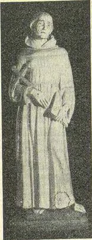
Della Robbia: Socha sv. Františka (bazilika P. Marie Anjelskej)