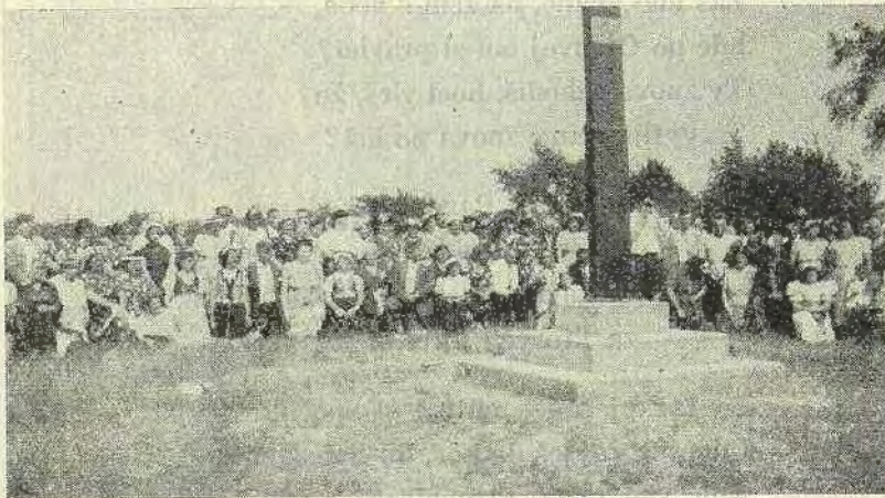
Torontskí Slováci pri kríži v Midlande (Canada)

Kríž na Midlandskom vršku, len niekoľko metrov vzdialenom od pútnického chrámu, nesie tento anglický nápis. This