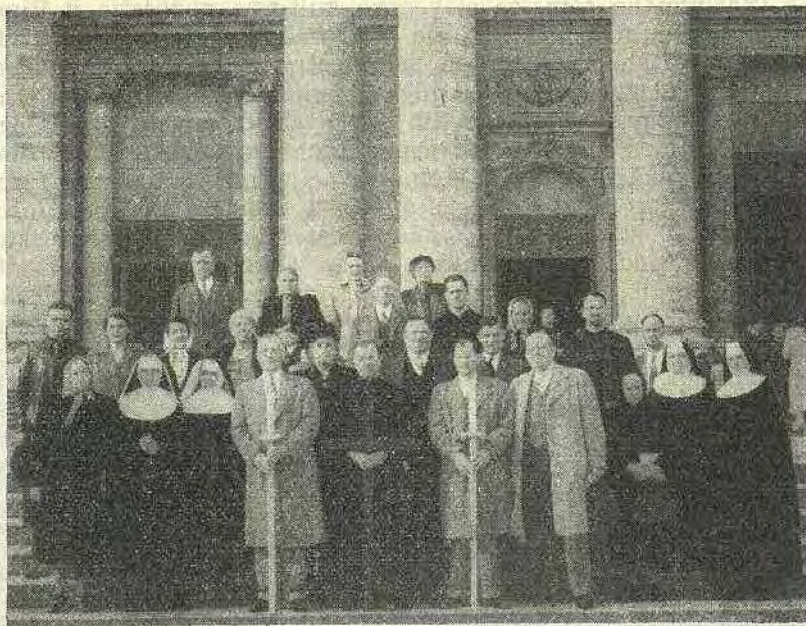
Púť amerických Slovákov