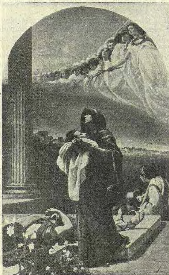
«Mučenie sv. Alexandra» od P. Loveriniho vo Vatikánskej galérii moderného umenia