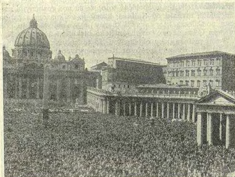
Pohľad na Vatikán na Veľkú noc 1950

Akýsi druh veľkých amerických magazínov, kde každý a za podvýrobnú cenu dostane všetko: umelé cirkvi, pružné kréda, filozofické kombinácie, duchovné vazeliny k lepšiemu tráveniu požívajúc, s dokonale napodobenými náhražkami: deizmus miesto Boha, teosofiu miesto teologie, spiritizmus miesto ducha, idealizmus miesto ideálov, modernizmus miesto modernosti, náboženské zeloženie miesto náboženstva, evanjelictvo miesto evanjelia, salutizmus miesto spásy a tu a tam racionalizmus miesto rozumu ... Medzi tým z úcty k estetike XX. storočia