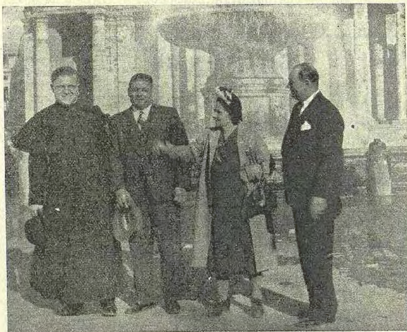
Prví americko-slovenski pútníci v Ríme

Padre Pio so dňa na deň sa mi stáva drahším. Nevynechal som nijakej príležitosti, aby som ho videl, bol v jeho blízkosti a pohovoril si s ním. To, čo on povie má nový smysel, neznámu duchovnú perspektívu a dosah. Nerozpráva veľa, ale to, čo povie je originálne štýlom, skladbou i poňatím. Jeho veta je stručná, zhustená, jasná. Veci chápe strašne ľahko a z niektorých jeho náražok cítim, že ma pozná, že ozaj vie o tom, čo sa deje v mojej duši. Pripravujem sa na odchod, ale s nesmiernou bola-